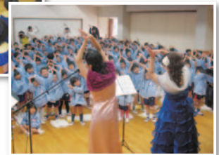
幼児・小学生を 対象とした お出かけ公演